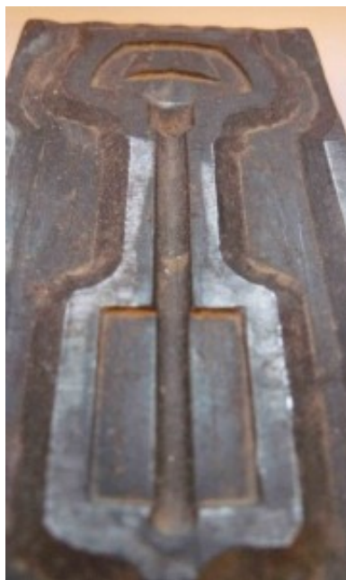
Petite métallurgie Vimeu – moule pour clefs

Paul Vincensini (« Quand même », éd. Saint-Germain-des-Prés)