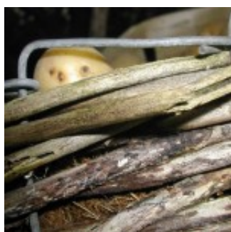
Carte numéro 1

Pour 4 cartes et plus : 1, 10 €/l'unité au-delà de 3 (frais d'expédition inclus)